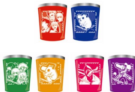
▲チェンソーマン ステンレスタンブラーセット (全3種) ※クレーンゲーム限定景品