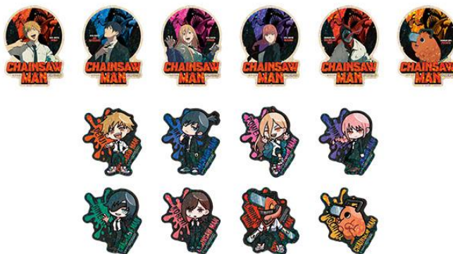
▲チェンソーマン ホログラムステッカー(全14種・ランダム) ※対象クレーンゲーム利用者限定

※数に限りがございます。なくなり次第、終了となります。 ※画像はイメージです。実物とは異なる場合がございます。