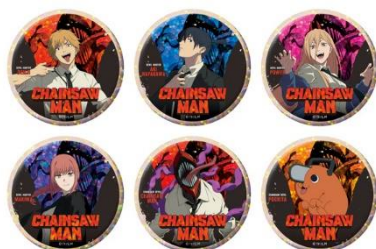
▲チェンソーマン ホログラム缶バッジ (全6種) ※クレーンゲーム限定景品