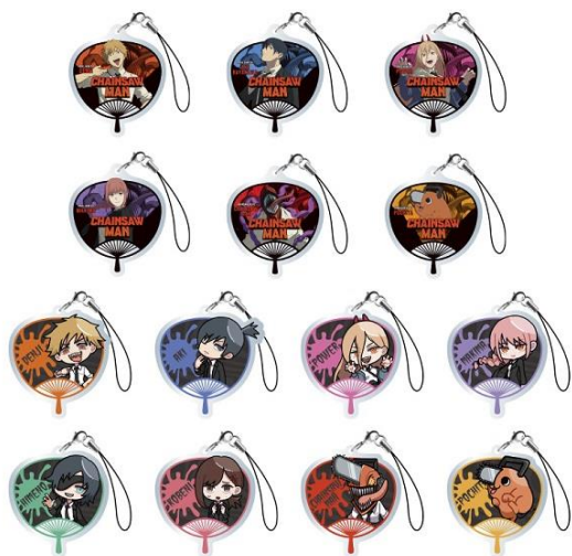
▲チェンソーマン うちわ風アクリルチャーム(全14種) ※クレーンゲーム限定景品