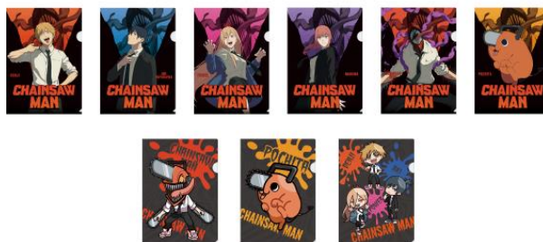
▲クリアファイルコンプリートセット チェンソーマン クリアファイル(全9種)

GiGOグループのお店公式Twitter(@GENDA_GiGO)をフォローしてから、 対象ツイートをリツイートすると抽選で3名さまにクリアファイルコンプリートセットをプレゼント！