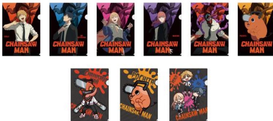
▲チェンソーマン クリアファイル(全9種) ※対象クレーンゲーム利用者限定

※好きな絵柄をお選びいただけます。 ※数に限りがございます。なくなり次第、終了となります。 ※画像はイメージです。実物とは異なる場合がございます。