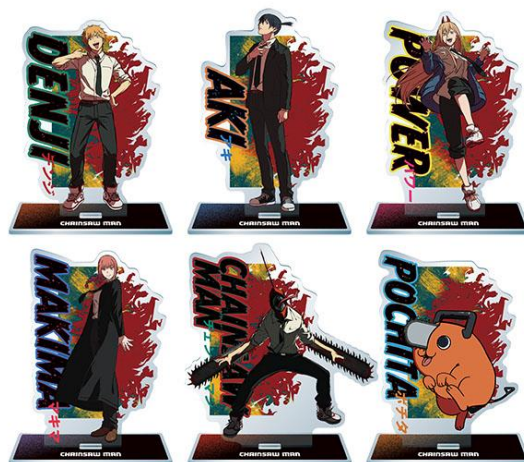
▲チェンソーマン BIG アクリルフィギュア(全6種) ※クレーンゲーム限定景品