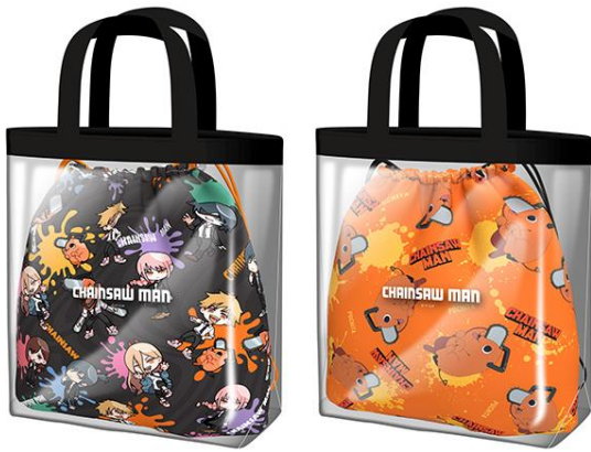
▲チェンソーマン 巾着付きクリアトート(全2種) ※クレーンゲーム限定景品