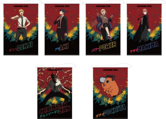
▲チェンソーマン B2 タペストリー(全6種) ※クレーンゲーム限定景品